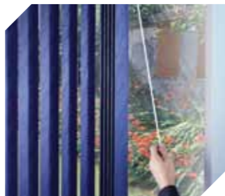
Persiana vertikál ne'ebé operadu ho ai-batuta - dudu no dada ba iha pozisaun ho ai-batuta ne'ebé bainhira dulas sei inklina (loke taka) persianas ne'e

Persiana motorizada mós halakon tiha neseseidade ba talin atu funsiona. Persianas ne'ebé halo ho ai no persiana esterna nian mak estilus seluk lahó fiu nian hodi enfeita janela.