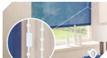
Konektór hodi hakotu korrente nian ne'e sei namkore bainhira iha todan ne'ebé liuresik, maibé depoizde halo tiha inspesaun bele habit hamutuk fali

Nota: Tuir lei haruka, iha limitasaun ba fiu no korrente nia naruk ba sistemas seguransa integradu nian.