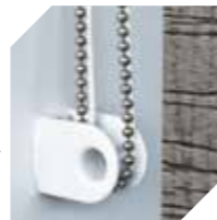
Tensionadór fiu no korrente ba persiana vertikál hodi estika fiu no korrente halo metin

Nota: Tuir lei haruka, iha limitasaun ba fiu no korrente nia naruk ba sistemas seguransa ne'ebé separadu.