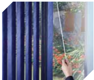
Vertikálne žalúzie ovládané pomocou tyče-zatiahnuté a vytiahnuté do polohy pomocou tyče, ktorá pri krútení otvára a zatvára žalúzie

Motorizované žalúzie tiež odstraňujú potrebu na prevádzku pomocou šnúry. Drevené rolety a vonkajšie žalúzie patria medzi iné štýly bez šnúrových systémov zatienenia okien.