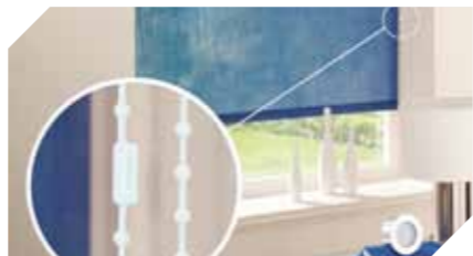
Konektor prerušenia reťaze sa preruší pri nadmernom tlaku, ale po prehliadke ho možno znovu zopnúť dohromady

Poznámka: Podľa zákona existujú obmedzenia dĺžky šnúry a reťaze pre vstavané bezpečnostné systémy.