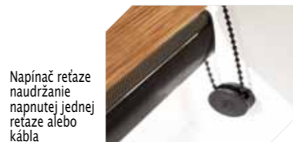
Napínací reťaz na udržanie napnutého kábla