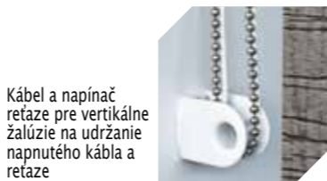
Kábel a napínací reťaz pre vertikálne žalúzie na udržanie napnutého kábla a reťaze

Poznámka: Podľa zákona existujú obmedzenia dĺžky šnúry a reťaze pre samostatné bezpečnostné systémy.