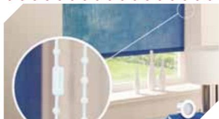
Conectorul de blocare a lanțului se va desprinde sub presiunea unei greutăți necorespunzătoare însă va putea fi prins din nou după ce este verificat

Notă: în cazul sistemelor de siguranță integrate, lungimea șnururilor și a lanțurilor este reglementată prin lege.