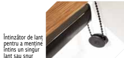
Întinzător de lanț pentru a menține întins un singur lanț sau șnur