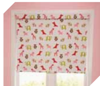
Jaluzele tip rulou cu arc - anumite modele sunt prevăzute cu un reductor astfel încât jaluzeaua să fie rulată cu o viteză redusă și constantă