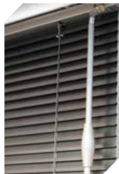
În cazul jaluzelelor venetiene, lamelele sunt înclinate iar jaluzeaua se ridică sau se coboară cu ajutorul baghetei poziționate pe partea dreaptă a acesteia