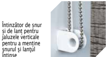
Întinzător de șnur și de lanț pentru jaluzele verticale pentru a menține șnurul și lanțul întinse

Notă: în cazul sistemelor de siguranță separate, lungimea șnururilor și a lanțurilor este reglementată prin lege.