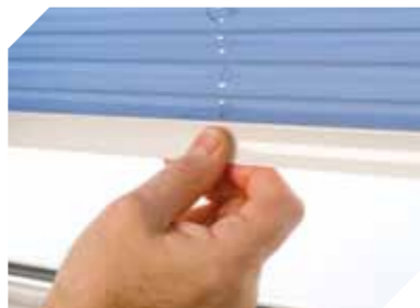
Roleta plisowana z naciągami – wszystkie linki rolety są stale naprężone, a roletę ustawia się, odpowiednio ją podnosząc lub zaciągając.

Żaluzja wenecka wyposażona w drążek służący do ustawiania odchylenia oraz podnoszenia i opuszczania listew