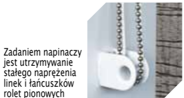
Zadaniem napinaczy jest utrzymywanie stałego napięcia linek i łańcuszków rolet pionowych

Uwaga: Przepisy prawa określają maksymalną długość linek i łańcuszków w roletach z oddzielnymi zabezpieczeniami.